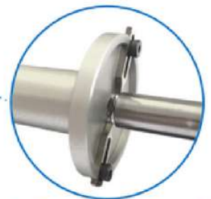
Outillage de préhension modulaire